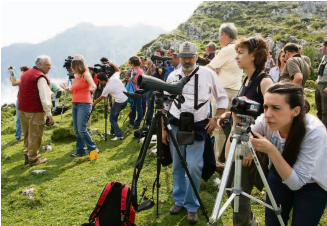
Decenas de personas esperaban ayer expectantes la suelta de los dos quebrantahuesos.